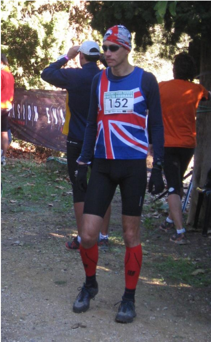
Kampklar i Catalonien

Den 16. november stillede jeg op på startlinjen til løbet Trailseries Les Ermites , et 22km trailløb med knap 1000hm i den smukke Sierra del Montsant nationalpark i Catalonien, ca. 1½ timers kørsel fra Barcelona. Vejret var perfekt, kølig luft – ca. 10 grader – og flot solskin.